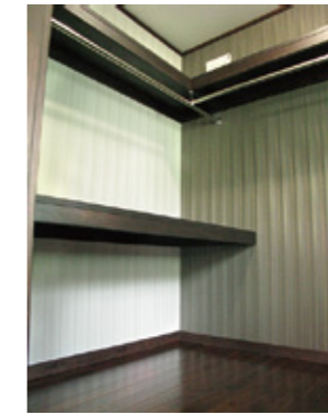
室内LANボードを設置して配線をスッキリ。