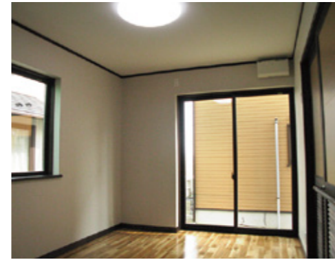
将来同居をするご両親の為の寝室。