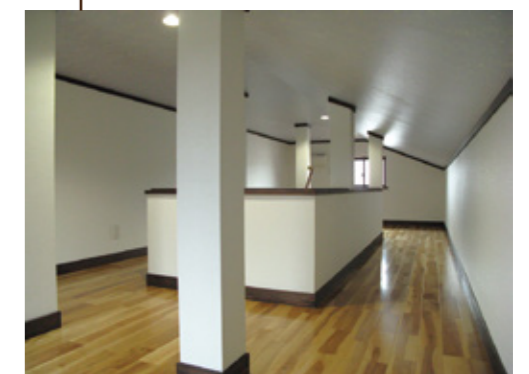
子供の遊び場や収納など様々な用途に活躍。