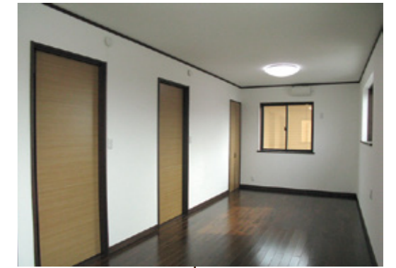
将来2部屋に分けられる様 予め建具を2カ所設置。