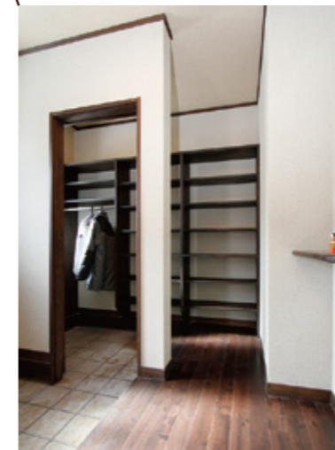
コートも掛けられる大容量のシューズクローク。