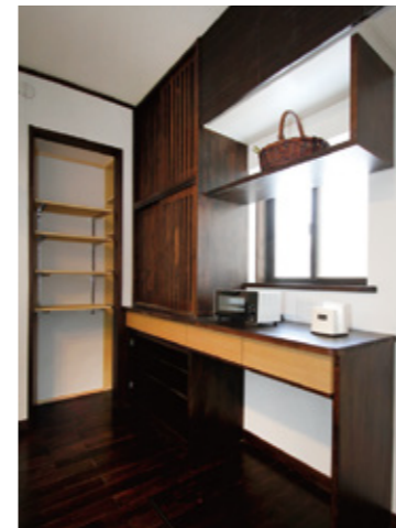
これから使う家電製品の寸法などをお聴きして設計したオーダーメイド収納。