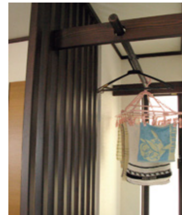
キッチンの近くに設けた物干し場は木の格子で目隠し。