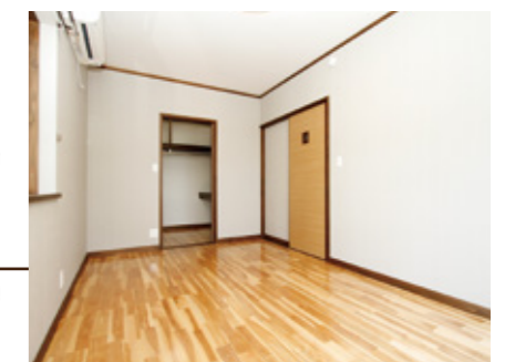
ウォークインクローゼットを隣接させた寝室は有効利用出来るスペースが増えます。