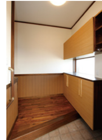
飾り棚を兼ねた大容量の造付け玄関収納。