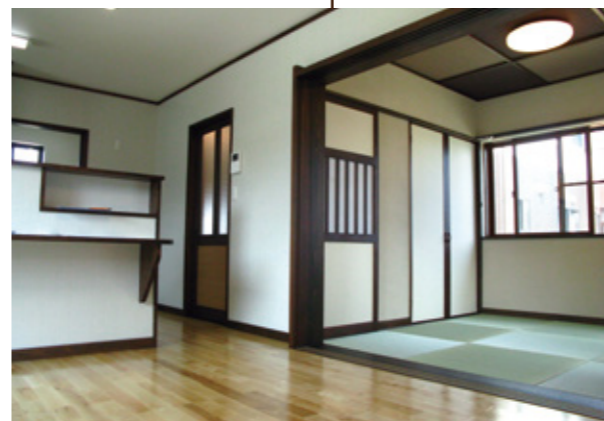
右側のドアの中は実は階段下収納という和室。リビングと一体としても活用できます。