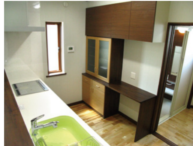
カウンター一体型の造付けの家具で調理の効率をアップ。