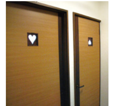
トランプのマークが目を引くオリジナル建具。