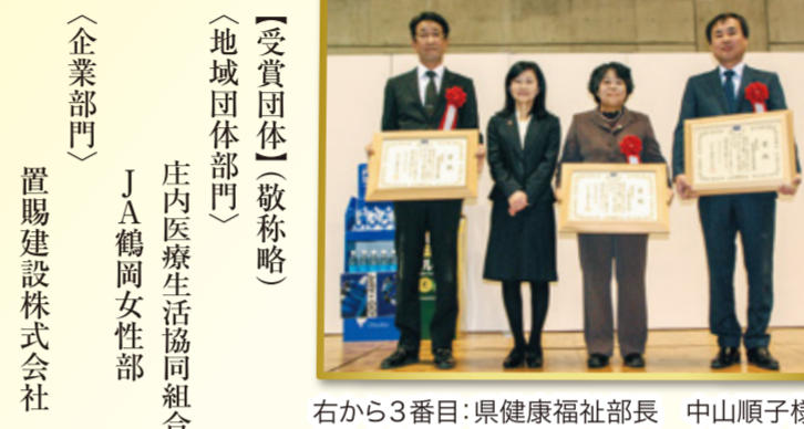
【受賞団体】(敬称略) 庄内医療生活協同組合 (地域団体部門) J A 鶴岡女性部 (企業部門) 置賜建設株式会社

山形県では、「健康長寿やまがたの実現」を目指し、健康寿命を伸ばすための取り組みを進めており、その一環として、健康づくりに積極的に取り組む企業や地域団体等を顕彰する「やまがた健康づくり大賞」を平成27年度から実施しています。