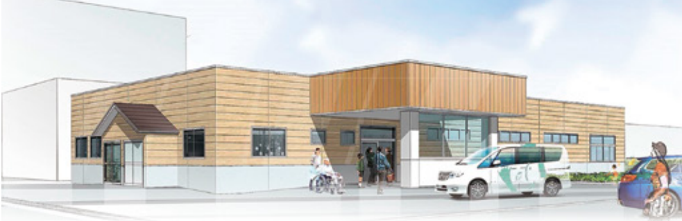
協立デイケア完成予定図

私たち医療生協はどのような問題が生じないような無差別・平等の地域包括ケアを実践する二環として、A事業・B事業・一般介護予防事業の取り組みを行っていきま