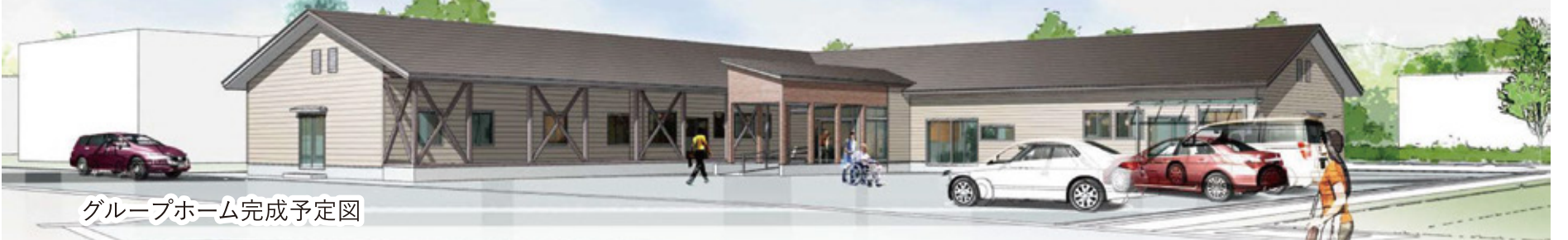
グループホーム完成予定図