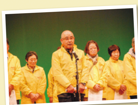
実行委員のみなさん

ふれあいフェスタは、鶴岡市中央公民館を会場に3月4日(土)・5日(日)の両日開催され、延べ500名の参加者で賑わいました。 4日午後から公開した展示コーナーには12のグループとサークル、個人65名のみならず380点もの力作を展示していただきました。どの作品も素晴らしい、多彩な内容で組合員のみならず、地域で活躍されている様子が伝わります。 また、5日午前の「健康づくり発表会」では13支部からスライドを使った「支部主催の保健大学」の報告や「つとのおきの健康法」など寸劇や体操など嗜好を凝らした発表がありました。 午後からは、踊りや、三味線、フルートの楽器演奏、キッズダンスなど21の演目が披露されました。出演されたみなさんは日頃の練習の成果をステージで堂々と発表していました。会場は拍手や笑顔があふれ、出演者と観客席が一体になった文字通り組合員のふれあいの場となりました。参加されたみなさん、また実行委員のみなさん、ありがとうございました。 ふれあいフェスタ実行委員会 事務局 今野直記