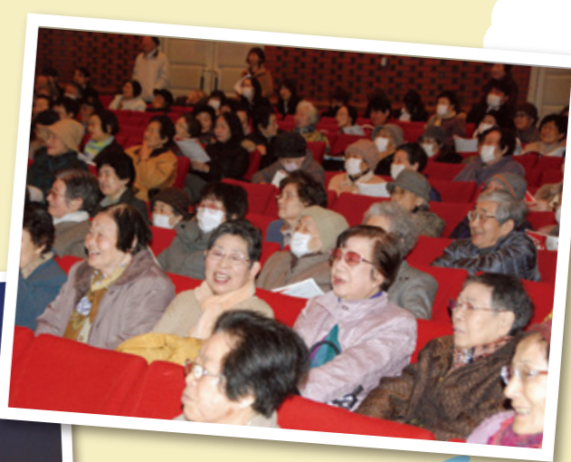
笑顔があふれる客席