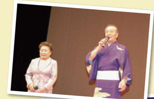
午後の司会のお2人