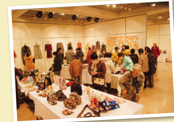
力作ぞろいの展示会場

◎作品はどれも素晴らしい、みんな一緒に作ったものは楽しんで笑う声が聞こえてくるようでした。 ◎皆さん色々なことを実践し素晴らしい効果を目指していることに驚きました。少しでも皆さんと共に頑張りたいと思います。 ◎どの若も楽しく愉快でした。体も心もほぐれてすがすがしい一日でした。 ◎ステージと観客が一体となり、拍手あり、笑いあり、生の演奏など盛りだくさんで元気をもらった楽しい時間でした。実行委員の皆さん本当にお疲れ様でした。 感想をご紹介いたします