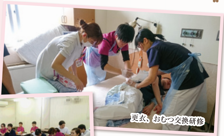
更衣、おむつ交換研修

今年度、当法人は、新入看護職員13名を迎えることができ、そのうち鶴岡協立病院には、10人が配属となりました。新人看護師研修と教育担当である主任として、4月6日から24日から看護手順・基準に沿って二つひとつの手順を教えてもらい、学校で教わった時とは違うところもあるな...と感想をもちながらも、みんな元気に研修を終えることができました。4月25日からは、教わった看護技術を配属先の病棟で実際に行います。不安もあると思いますが、自信を持って看護行為ができるように、部門全体で大事に育てていきたいと思えます。