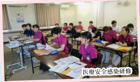
医療安全感染研修