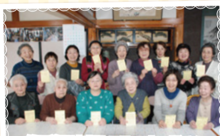
第5学区支部なごみの家の皆さん