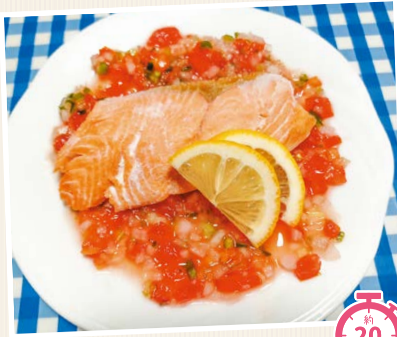
レシピ 鶴岡協立病院 栄養科 調理師 瀬尾有香