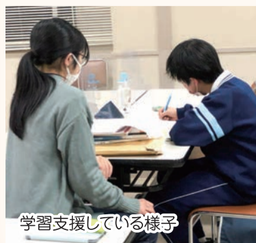
学習支援している様子

最後に「無料学習塾＆なんでも相談室」の取り組みをご紹介します。山形の子もたちを勉強や悩みを聞くことを通じて支援したいという学生の思いからこの活動が始まりました。今では継続して参加する学生もいて、さらなる広がりが見込まれます。