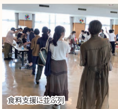
食料支援に並ぶ列

二つ目は、「母ちゃん食堂」です。村山地域の組合員の方々の手作りのお弁当を、月に1回学生へ無料で配布しています。