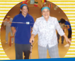
フリーフリー青組