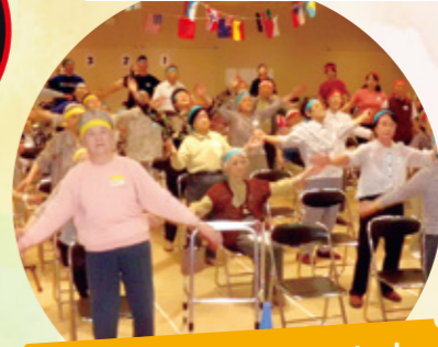
準備運動もしっかりと!

《黄組団長コメント》 一昨年ぶりの参加で、まさかの『応援団長』。「えーっ!!」と驚きましたが、当日はお客様のがんばりや笑顔を拝見し、心の底から楽しく応援することができました!