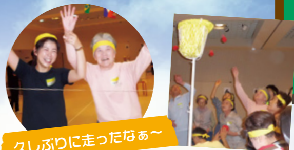
なかなか入らず悪戦苦闘