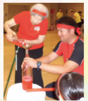
いろいろ競走 あわてず、あわてず…