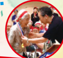
優勝チームには、おひとりおひとりに金メダルの授与

《赤組団長コメント》 初団長を任せ緊張しましたが、職員、御利用者様の一体感に助けられ、見事優勝でき、絆が深まりました。