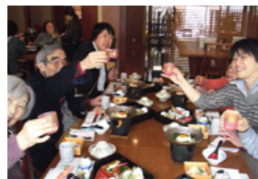
▼いろんなところへ行きましたね