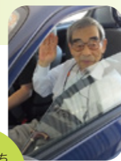
今日はどちらへお出かけですか...

出かけたい時に出かける。運動したい時に運動する。毎日が自由な時間。スケジュールを自分で決め、心地よい一日がスタートします。「一日一笑」今日も笑顔で暮らします。