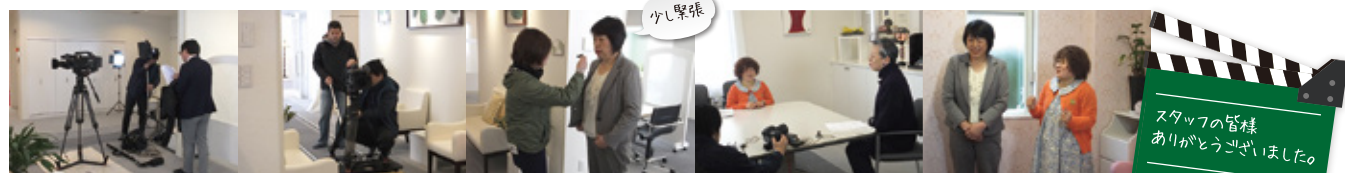
・機材を運び込み館内の撮影から始まり ・マイクを付けてスタンバイ ・打ち合せしながら… ・いざ本番