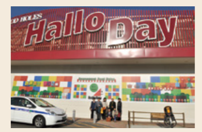
●日本一視察の多いスーパーマーケット ハローデイズ見学