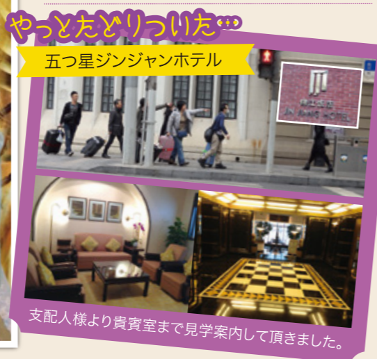
やっとたどりついた 五つ星ジンジャンホテル 支配人様より貴賓室まで見学案内して頂きました。