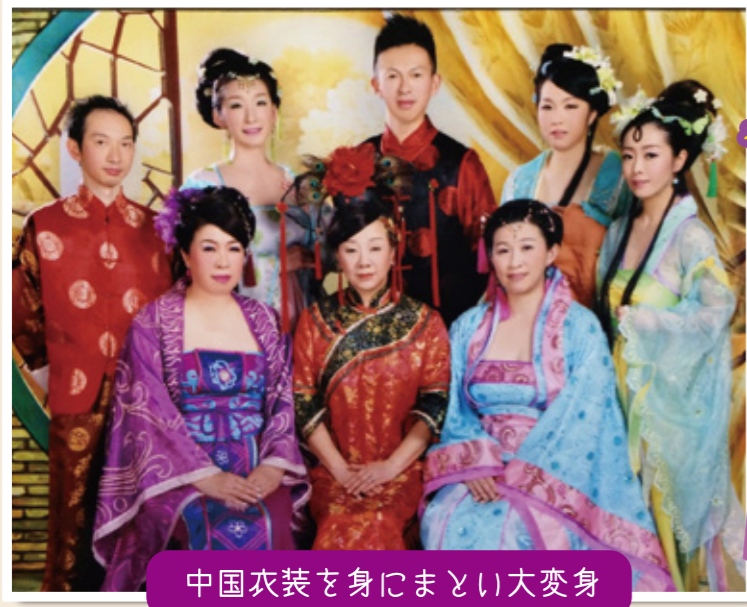
中国衣装を身にまとい大変身

何の為の社員セミナー? ただの旅行でなくて... 何回も何回も 集まっては相談し、 悩んで悩んで... きっと 私達の仕事は 感動を提供する仕事... 今回のセミナーでの 出会いや出来事で 感じたこと その感動を感じる為の セミナーだったような... 次回は、どのような セミナーに なるのでしょうか?