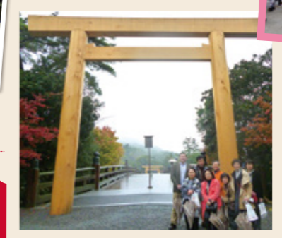
●幻想的な早朝の伊勢神宮。朝のライトアップはとてめずらしいとの事。