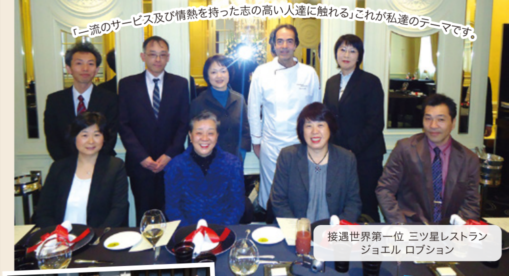
「一流のサービス及び情熱を持った志の高い人達に触れる」これが私達のテーマです。