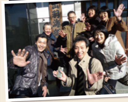
●相撲部屋の朝稽古見学～両国～