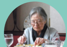
ナイフとフォークを持つ手も真剣です。

「コース料理なんて久しぶり〜！」「素敵なお皿だこと〜！」。会話も弾み一つずつ出てくるお料理に“なつかしさ”もプラスとなったお食事会になりました。