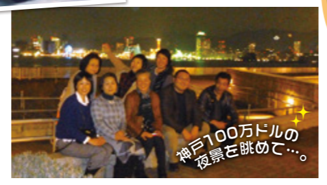
神戸100万ドルの 夜景を眺めて...