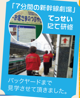
「7分間の新幹線劇場」 てっせいにて研修 バックヤードまで 見学させて頂きました。