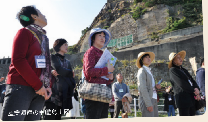
産業遺産の軍艦島上陸