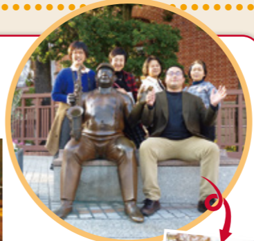
おかげじやく (塾・熟)

神戸・伊勢を巡る、私達「おかげ塾」8名一行は、11月24日に仙台空港を旅立ちました。一番の目的だった「伊勢神宮参拝」では外宮・内宮の参拝両日、激しい雨、広大な境内に聳え立つ御神木に目を奪われながら、雨に煙る参道を進んでいると、清浄な空気感が沁み込んでくるようでした。雨も「不浄を洗い流す恵みの雨」と喜んで迎えようという気持ちになれ、雨・土・自然の恵みに感謝する事を尊んできた日本人の心のルーツを学んだ貴重な旅となりました。