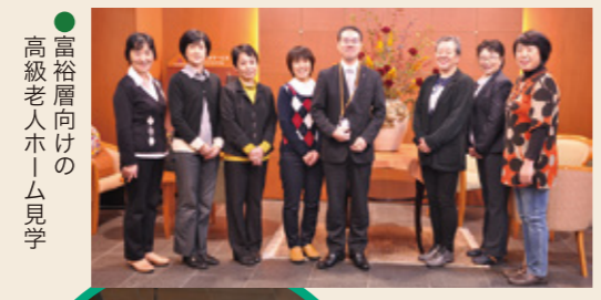
●富裕層向けの 高級老人ホーム見学

鶴岡から離れ九州の歴史と文化に触れてきました。8月から4ヶ月間打ち合わせを重ね、計画から全て自分達で練り上げ、最高のチームワークでセミナーの先陣を切りました。