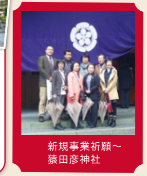
新規事業祈願～ 猿田彦神社