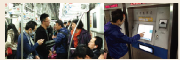
●移動はすべて 地下鉄のみ

打ち合わせでメンバーの1人から出た言葉。「上海に行きたい!」という発言に全員賛同で決定した今回のセミナー。日本との文化の違いを改めて実感でき、とても貴重な経験をさせてもらい学びの多いセミナーとなりました。