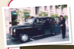
●おもてなしとアイデアの 近畿タクシー研修、今回は 夜景タクシー乗車。