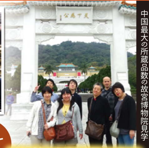
中国最大の所蔵品数の故宮博物院見学