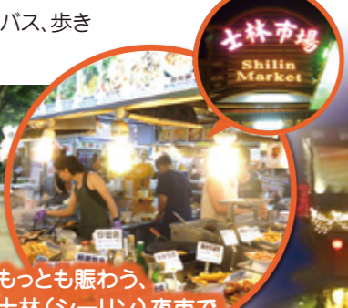
もっとも賑わう、士林(シーリン)夜市で食文化にふれる。