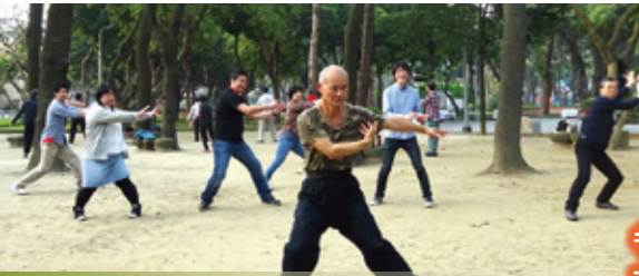
太極拳も習ってきました。