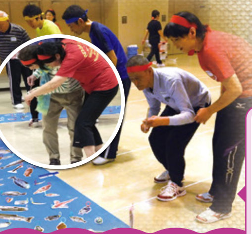
一発逆転釣りバカ競争

大きな魚をゲット!でも、魚の裏には得点が記入してあります。ただの魚釣りではありません。一発逆転の可能性大、最後の最後まで一位のチームがわからない!そんなワクワク感のある競技です。