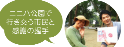
二二八公園で 行き交う市民と 感謝の握手