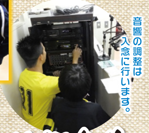
音響の調整は入念に行います。