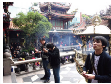
▲龍山寺でお参り、皆が幸せになりますように。