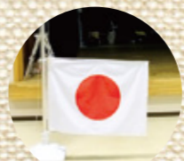
国旗掲揚新調しました。