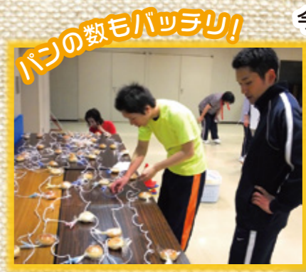
パンの数もパツパツ!