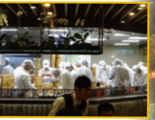
たくさんの職人さんの手作り