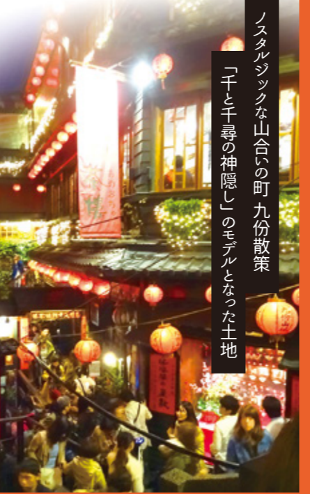
ノスタルジックな山合いの町 九份散策 「千と千尋の神隠し」のモデルとなった土地