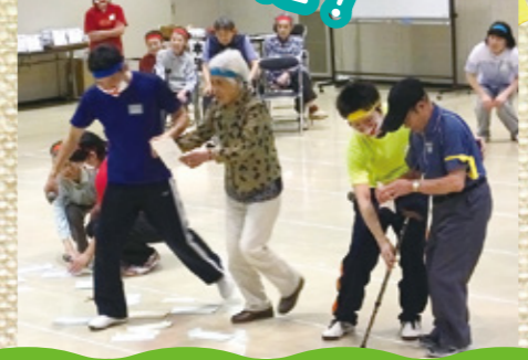
一発逆転ミッションゲーム