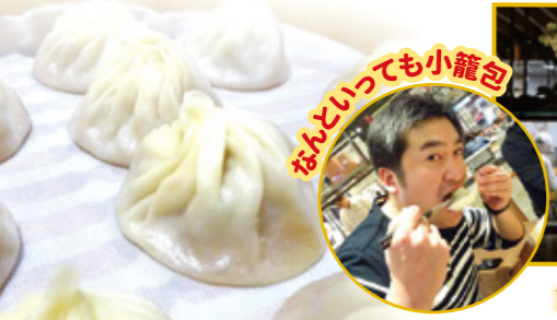
なんといっても小籠包