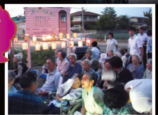
コンテスト前のひとときに灯籠を眺めながら

今年で2回目となります灯籠コンテスト。今年もたくさんさんの素晴らしい作品が集まりました。どれも甲乙つけがたい作品ばかりでしたが、5つの作品に賞を贈らせて頂きました。夏の夜に灯籠と花火の綺麗な灯りが咲き乱れ、幻想的な時間をお過ごし頂きました。皆様の思い出のページに刻んで頂けたらうれしく思います。