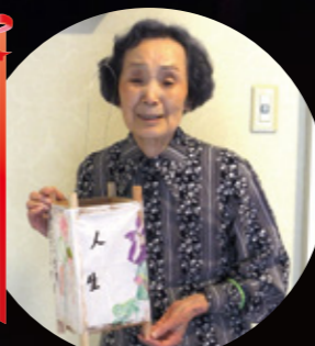
行事企画委員長賞