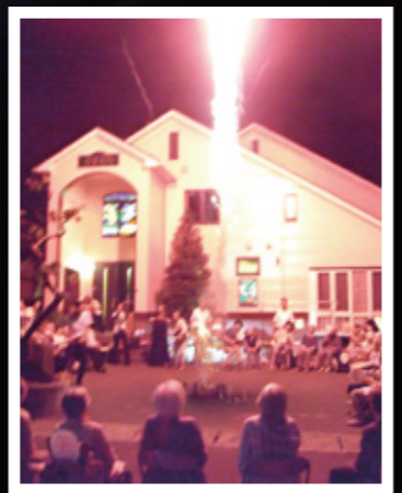
最後には手持ち花火、打ち上げ花火を楽しみました