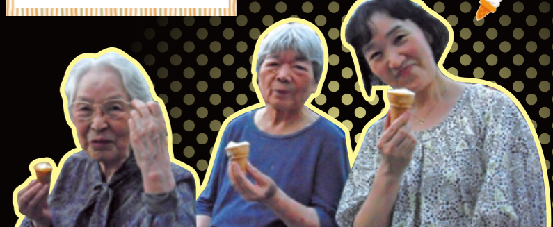
アイスおいしいね