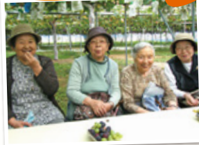
「佐久間ファーム」でふどう狩り