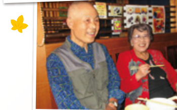
「とがし肉家」で焼肉