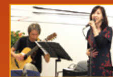
アフタヌーンコンサート オカリナとギターデュオ もくれん様

お食事をして、音楽を聴き、鑑賞後にはティータイム。ホテルイベントに参加しているような、そんなゆったりとしたひと時を過ごしていただきたいと秋の感謝祭を開催しました。