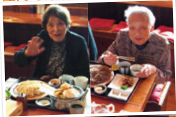
庄内旬味「悦波」でランチ