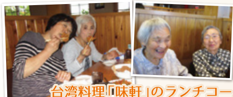
台湾料理「味軒」のランチコース