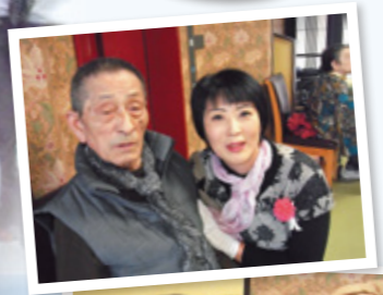
発表前に 緊張を やわらげて…