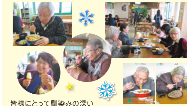
皆様にとって馴染みの深い「池田南銀座」様へショッピングとランチを楽しん来ました。