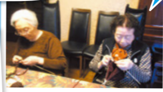
簡単にクロスができる裏ワザ使用