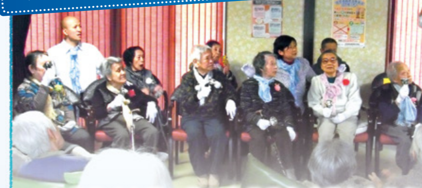
指揮者の合図で 演奏スタート戸 息ピッタリ