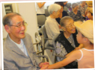
ちとせ保育園の 園児 元気いっぱいの 踊りに笑顔満開