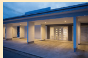
デイサービス アブラ ☎0235-64-0302 鶴岡市稲生一丁目4-53