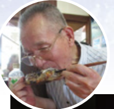
いいずん 朝日 タキタロウ館