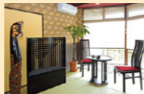
エタニティハウスひまわり ☎0235-25-5160 デイサービス いいずん ☎0235-64-0604 鶴岡市稲生一丁目3-45