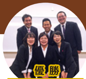
優勝 事務所チーム

ひまわりでは、10年程前から、その日の士気を上げる為に、「活力朝礼」に取り組んでいます。外部から三名の審査員を迎え、今回の朝礼コンテストは、審査項目に新たに、「オリジナリティー」を追加しました。各チームでアイデアを出し合い、勤務時間外で