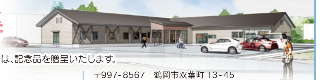
※グループホームイメージ

〒997-8567 鶴岡市双葉町13-45 庄内医療生活協同組合 組織部 ☎0235-22-5769 Eメール: smc_soshiki@shonai-mcoop.jp